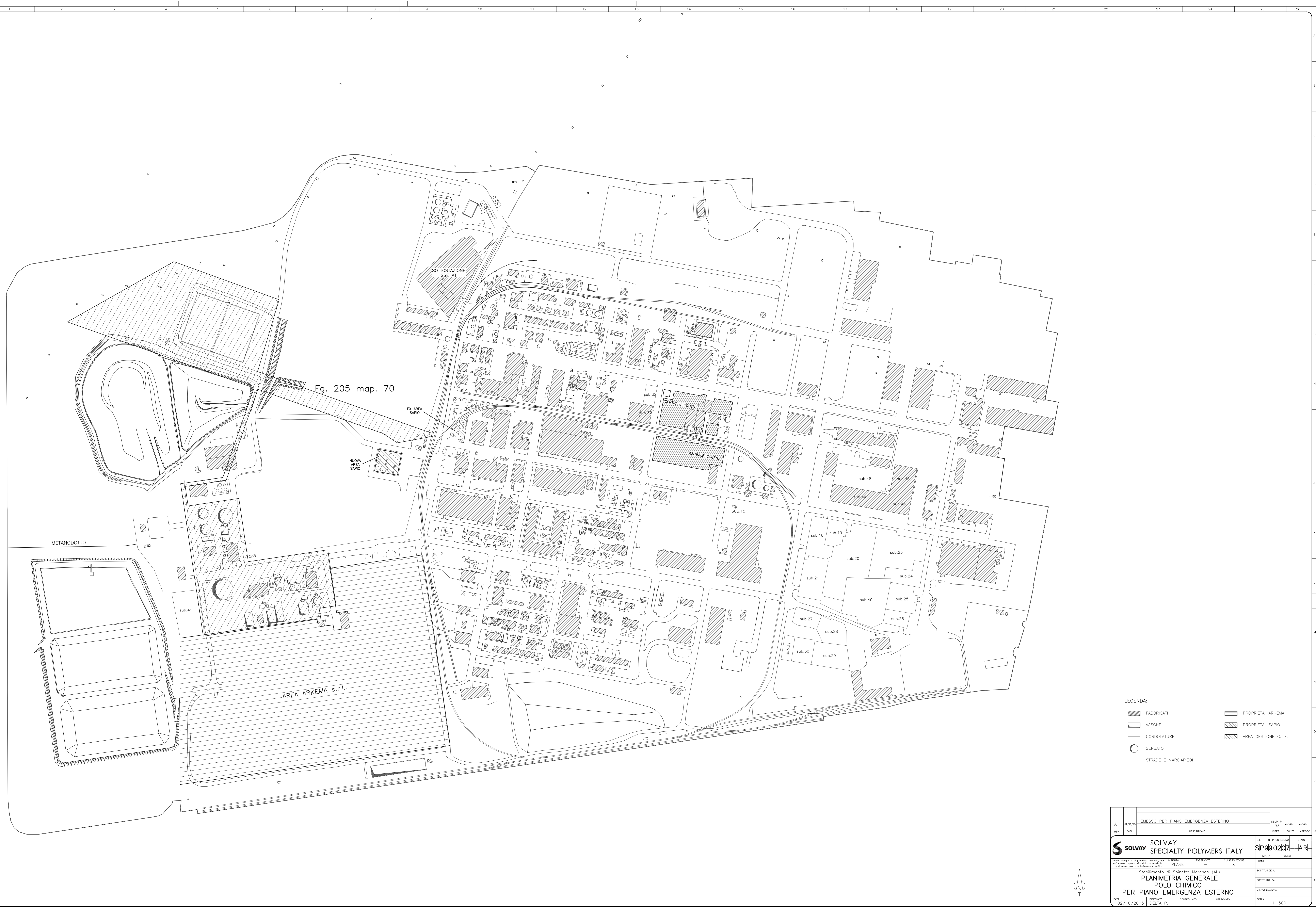
Fg. 205 map. 70