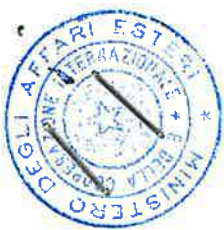
TABELLA DI EQUIPOLLENZA I

Per la conversione delle patenti rilasciate nel Principato di Andorra con le categorie di patenti antecedenti a maggio 2022, in documenti italiani