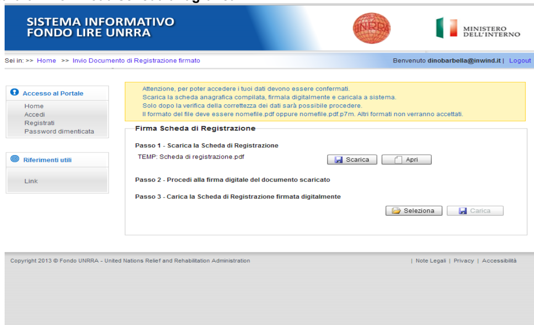
Figura 6 – Download scheda anagrafica