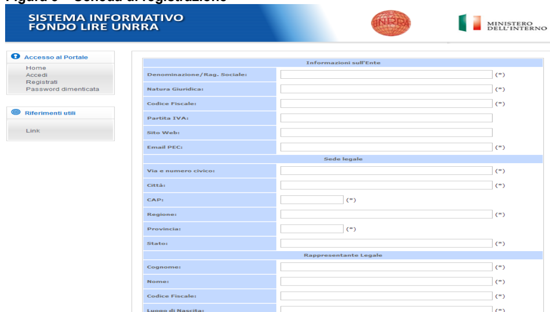
Figura 3 – Scheda di registrazione