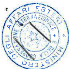
TABELLA DI EQUIPOLLENZA I

Per la conversione delle patenti rilasciate nel Principato di Andorra con le categorie di patenti antecedenti a maggio 2022, in documenti italiani